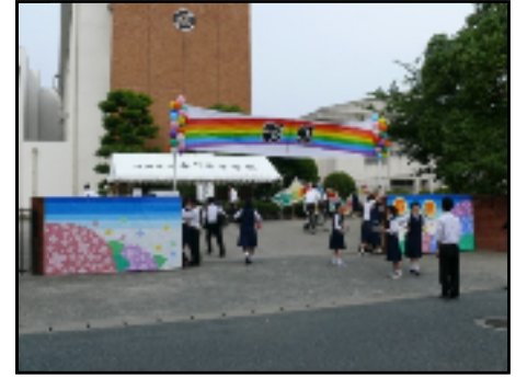
▲テーマの「彩虹」の周りにアジサイが咲き乱れます。

● 初めての春日高校での合唱コンクールは私にとって、とても思い出に残るものとなりました。パフォーマンスや歌の練習などは、ほとんど生徒自身が考え、中学校とはまた違う経験ができたと思います。各クラスの歌のレベルも高くて驚きました。来年もまた頑張ろうと思います。