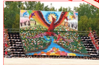
▲バックボードと人文字で巨大な絵を作り出します。

また、悪天候の中にもかかわらず多数のご来場をいただきました。心よりお礼申し上げます。