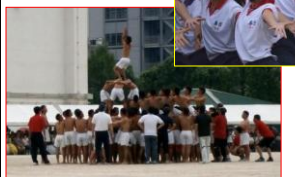
▲練習の成果を存分に発揮しました。