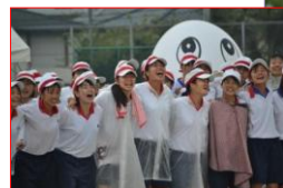
▲最後は輪になって校歌斉唱。雨の中でも笑顔！