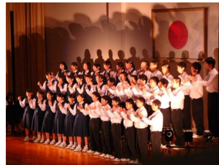
▲手話を交えた合唱も行われました。

●僕たちのクラスは「証」という曲を合唱しました。練習時から四組の絆を見せつけよう!!という想いで全員が一つになり、練習を積み重ねました。すれ違いもあり