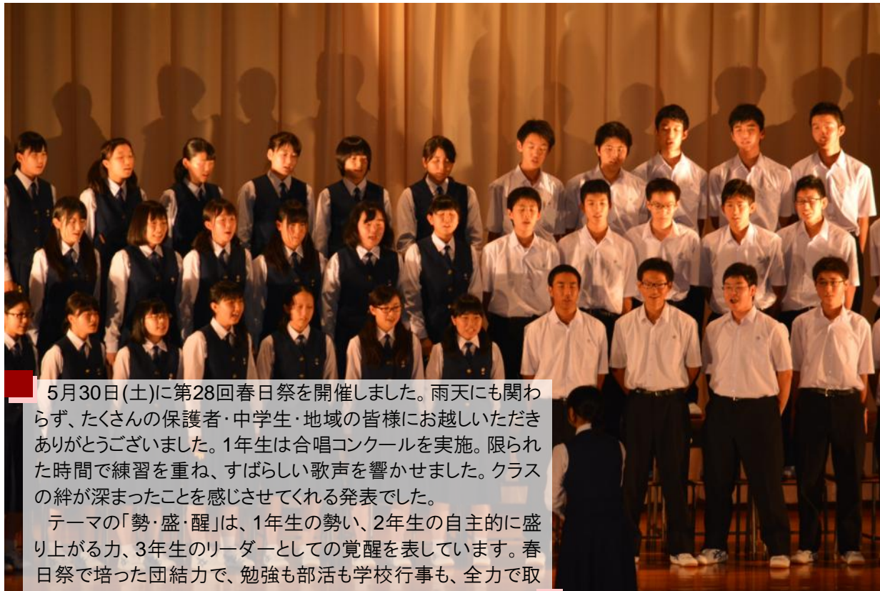
写真：1年生合唱コンクール最優秀賞1年5組

5月30日(土)に第28回春日祭を開催しました。雨天にも関わらず、たくさんの保護者・中学生・地域の皆様にお越しいただきありがとうございました。1年生は合唱コンクールを実施。限られた時間で練習を重ね、すばらしい歌声を響かせました。クラスの絆が深まったことを感じさせてくれる発表でした。