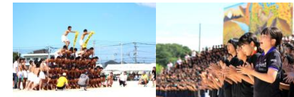
昨年の大運動会の様子

9月に行われる大運動会の実行委員会が発足。ブロック割りも決まり、ブロック長、副ブロック長、各セクションのリーダーが決まりました。3年生にとっては、大運動会が高校生活最後の行事です。大学入試に向けた受験勉強と、大運動会の準備を両立するため、3年生は下校時間ギリギリまで頑張ります。