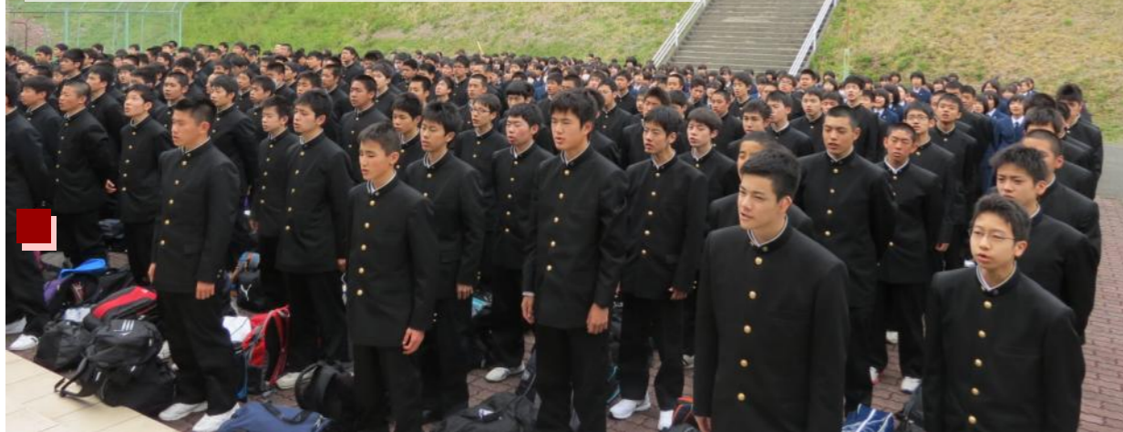
写真:入学後初めての行事に「凜」と臨む

4月16日(水)～4月18日(金)にかけて大分県中津江村の鯛生スポーツセンターで「きらめきキャンプ」が行われました。ウォークラリーや大縄跳び、講話、集団行動訓練など、仲間と一緒に活動していく中で、クラスや1学年の結束力を高めることができました。新入生はこのキャンプで学んだことをもとに本格的な高校生活をスタートします。