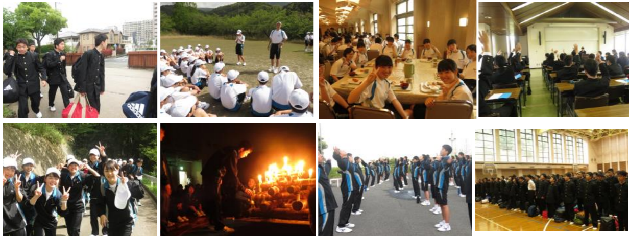
写真:41期生がクラス一丸となって集団行動に「挑戦」しています！！

4月15日(日)～4月17日(火)にかけて福岡県立社会教育総合センターで「きらめきキャンプ」が行われました。雨による場所等の変更にも臨機応変に対応し、集団行動や米の山登山、キャンドルの集い等、クラスや41期生の力を一つにして取り組むことができました。41期生の学年スローガンは「挑戦」。この経験で培った「チャレンジ精神」を日々発揮し、春日生としてこれから多くのことに「挑戦」していきます。