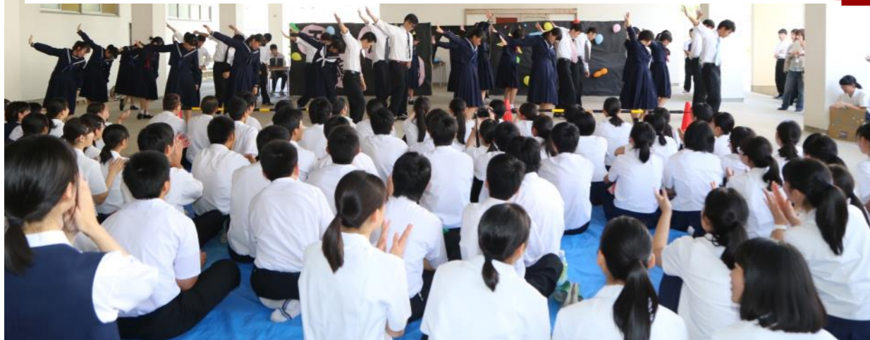
写真：3年生発表最優秀賞3年5組「手嶋坂39」(ステージパフォーマンス)

テーマの「Link～カラフルに彩れ～」は、生徒・先生・地域との繋がりを大切にしたいという思いと、個性を1つの色に例え、春日高校をカラフルに彩り、個性や明るさあふれる春日高校にしていこうという意味で設定しました。春日祭でできた仲間との「繋がり」を、大運動会などの学校行事や学校生活に繋げていきます！