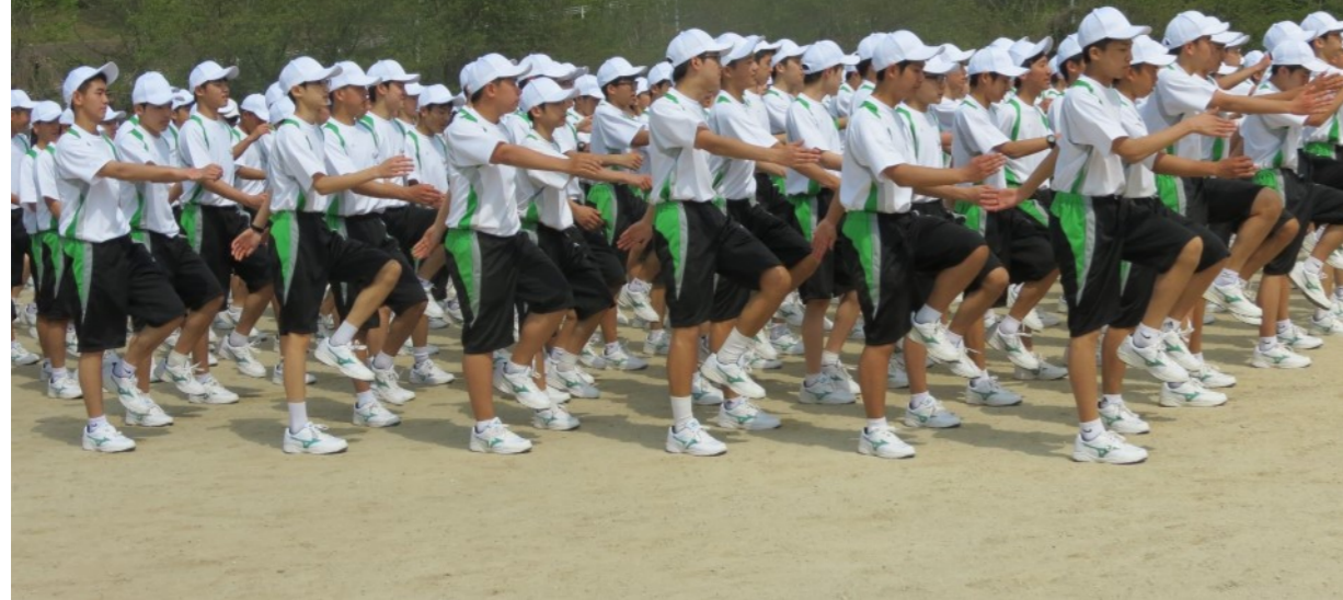
写真:結束力を高めるべく42期生が一丸となって集団行動に取り組んでいます！！

4月19日(金)～4月21日(日)にかけて福岡県立社会教育総合センターで「きらめきキャンプ」が行われました。3日間ともに晴天に恵まれ、集団行動や米の山登山、キャンプの集い等、クラスや42期生の力を一つにして取り組むことができました。42期生の学年スローガンは「行動力～見る前にとべ～」。この経験で培った「行動力」を日々発揮し、春日生としてこれから多くのことに失敗を恐れずチャレンジしていきます。