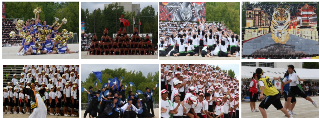
選手宣誓をする各ブロック長・副ブロック長

9月7日(土)に、第41回大運動会が開催されました。今年のスローガンは「覇天攻(はてんこう)」です。「今までに誰もやったことのないことに向かっていく」や「自分の殻を破る」などの意味が込められています。練習期間中は天候に恵まれず、計画通りに練習が進まないこともありましたが、実行委員やリーダーを中心に「今までにない新しい大運動会をつくる」という思いで、これまで準備をしてきました。当日は天候にも恵まれ、全競技予定通りに実施することができ、無事大運動会を終えることができました。